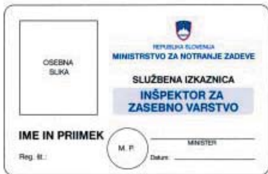
(sprednja stran identifikacijske izkaznice)