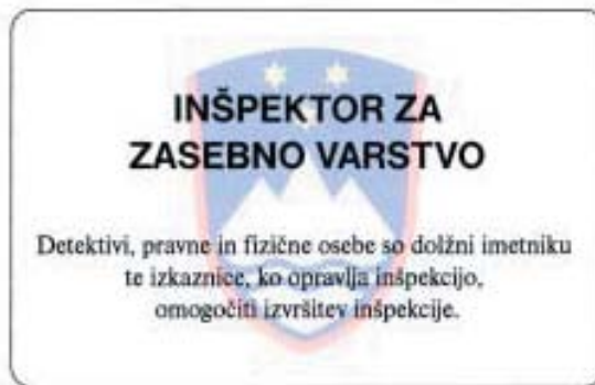
(sprednja stran plastificiranega kartončka)